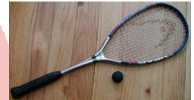
Squashschläger- und -ball